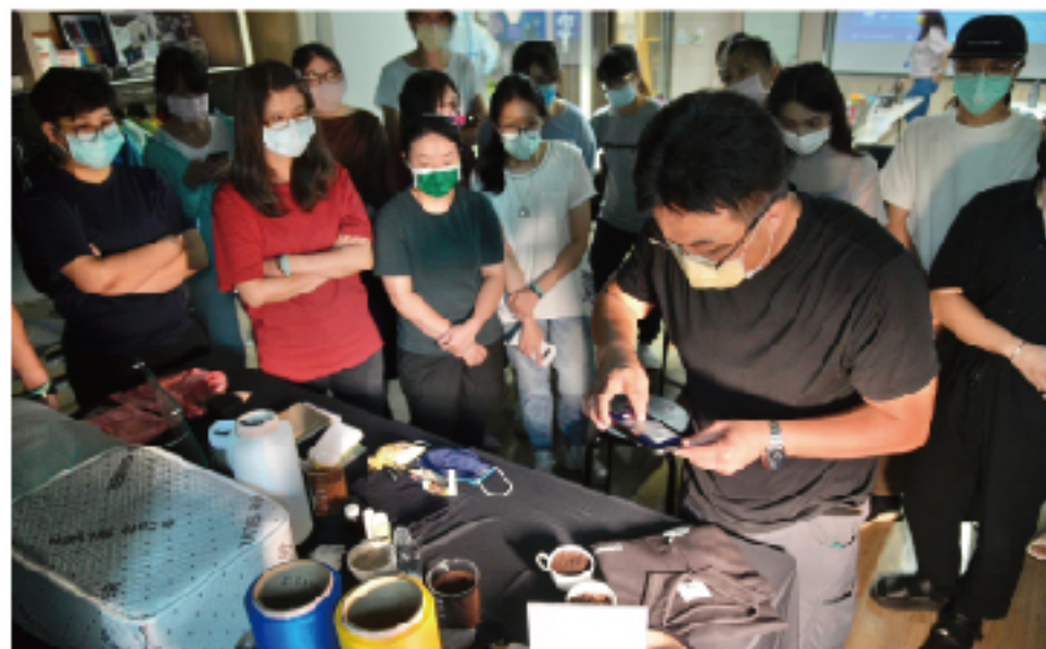
圖片提供-管理部 文字提供-林上瑛