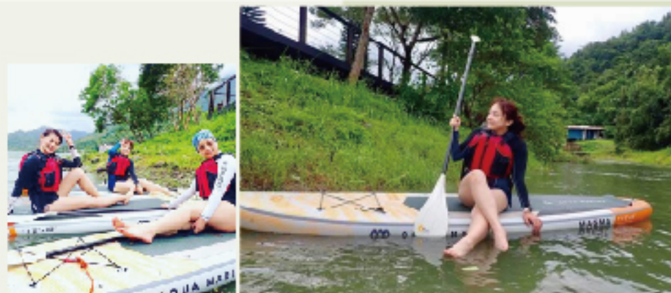
攝影 / 撰文 - 邱婉儀

眼看情勢不對，教練馬上請我們棄板到岸上涼亭處等待，心中滿滿感謝教練不離不棄，也感謝同行的夥伴互相加油打氣，一起安全平安的上岸躲避詭譎多變的風雨。雖然這次體驗活動滿滿遺憾，但經歷過大風大雨，劫後餘生後的姐妹友誼感情，一定會更加深厚美麗！也更深刻體會，「人生要把握每個當下，活得精彩，才不枉此生阿！」