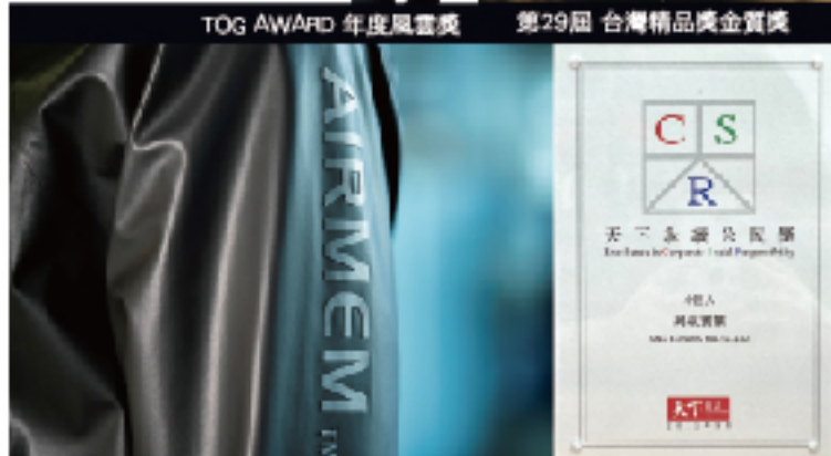
第29屆 台灣精品獎獲獎產品