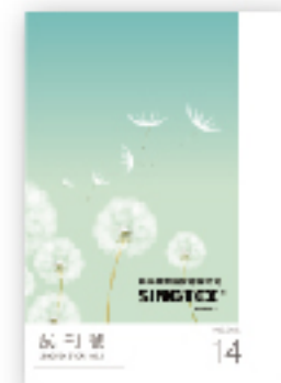
興采集團-試刊號 NO. 0 誕生