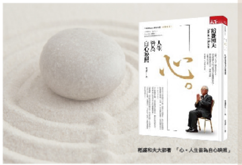
稻盛和夫大著「心·人生皆為自心映照」

企業文化是積沙成塔的，首先要落實的就是「不藏私」、「分享」，要讓文化形塑的種子像蒲公英般在集團內播撒飛揚！肩負企業文化推廣，必須要有方法、堅強意志力傳遞然後才能產生共識與影響，否則「文化」二個字就不能成立。