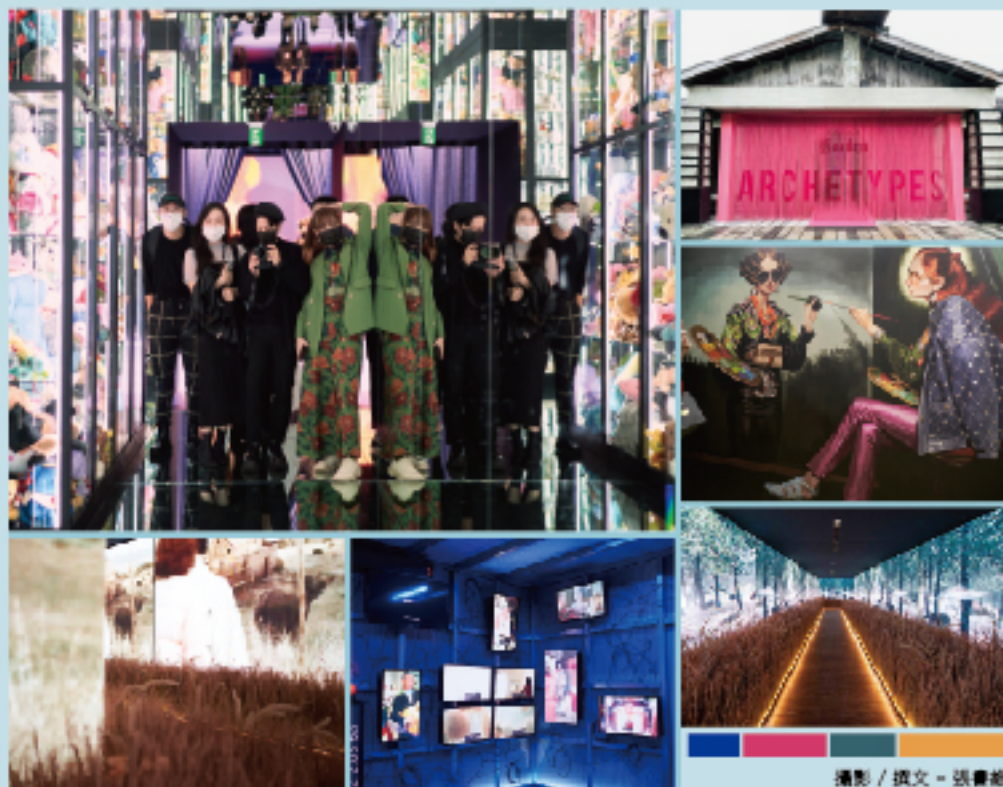
攝影 / 撰文 - 張書維